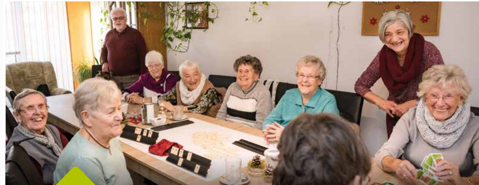
Es ist was los im Hörseltreff – dafür sorgen neben den beiden Ehrenamtlichen vor allem auch die ca. 50 Senioren, die sich regelmäßig hier treffen und gemeinsam etwas unternehmen.

Sprechstunden beim Geschäftsführer der SWG nach vorheriger telefonischer Vereinbarung.