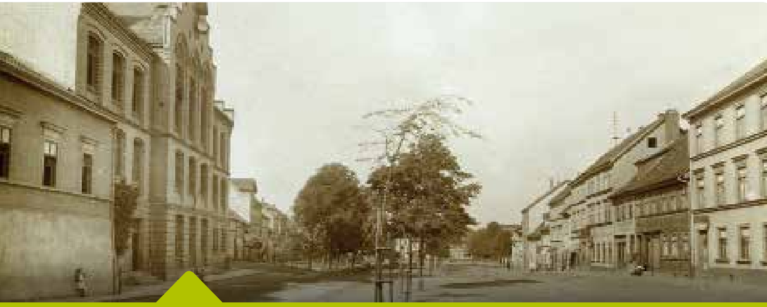
Fast in der Art eines Dorfborgers präsentierte sich die Katharinenstraße vor der Wende vom 19. zum 20. Jahrhundert; Blick vom Schiffsplatz aus; links die Elisabeth-Schule von 1888