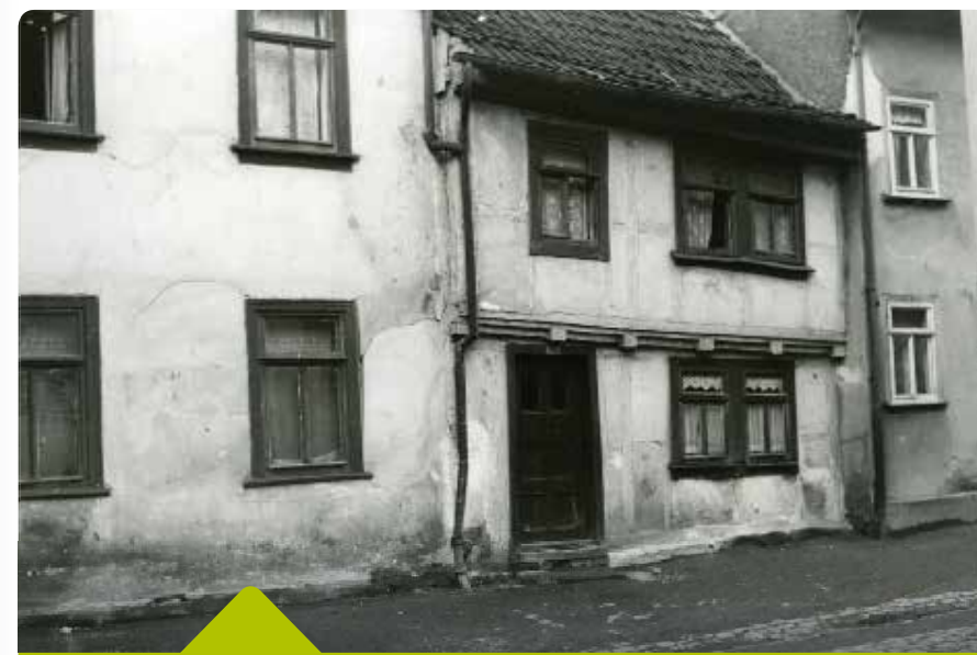
Teilweise sehr ärmlich waren die Wohnverhältnisse am Ehrensteig noch in der zweiten Jahrhunderthälfte

Ein Höhepunkt auf dem Weg der Weststadt zu einem modernen Teil Eisenach bildete die Einweihung des Haltepunktes Eisenach-West der Eisenbahnlinie Eisenach-Meiningen am 1. August 1893. Damit konnten sich die Weststädter den langen Weg bis zum Hauptbahnhof, immerhin etwa 2,5 Kilometer, künftig sparen. Sechzehn Jahre später wäre aber auch diese Strecke kein Problem mehr gewesen, denn die Straßenbahn erreichte nun die Weststadt. Es erfolgte eine Linienenerweiterung des bisherigen Netzes. Vom Markt fuhr die Bahn durch die Georgenstraße bis zur Katharinenstraße und dann durch die Kasernenstraße (heute: August-Bebel-Straße), später durch die Hospitalstraße zum Friedhof. Zwischen der Katharinenstraße und der Frankfurter Straße gab es einen Pendelverkehr. Die Strecke wurde am 16. Juni 1909 mit einem Volksfest eingeweiht. Und wieder war der Stiegk ein Stück näher an die Stadt herangerückt.