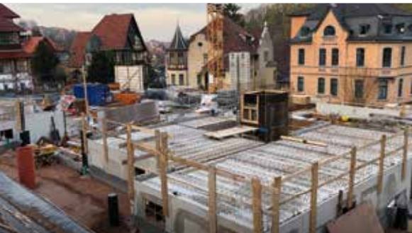
Das Kellergeschoss für die Tiefgaragenplätze ist bereits fertig gestellt.