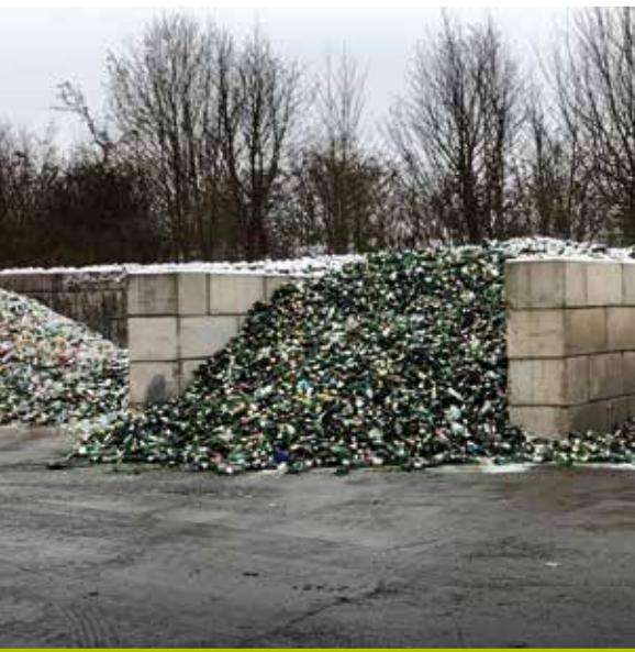
Nach Farben getrennt: die Gläser aus den Glascontainern