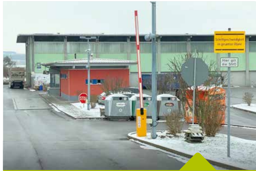
Der Wertstoffhof in Großenlupnitz steht den Eisenachern für die kostenlose Entsorgung von z.B. Grünschnitt, Schadstoffen oder Elektrogeräten zur Verfügung.